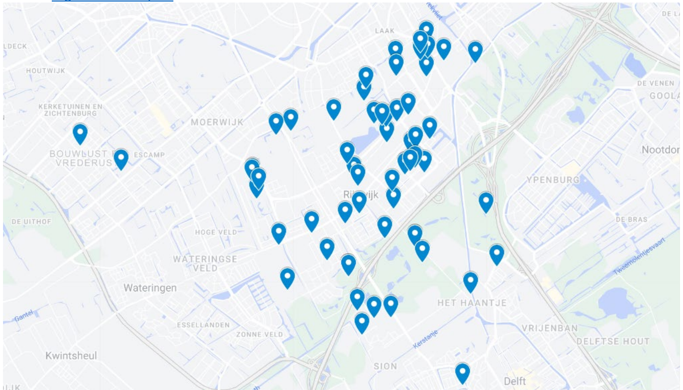
Figuur 1 Sportmogelijkheden in Rijswijk